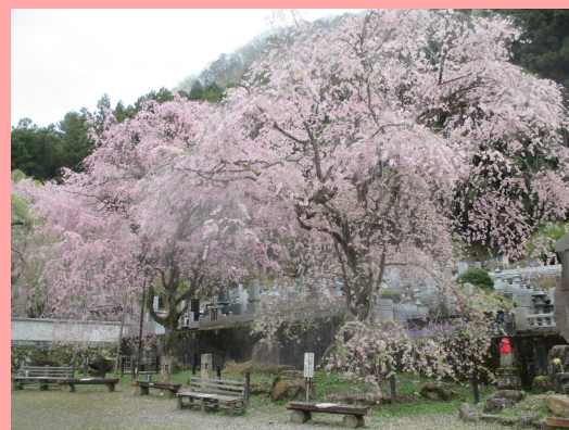
■清雲寺のしだれ桜の様子