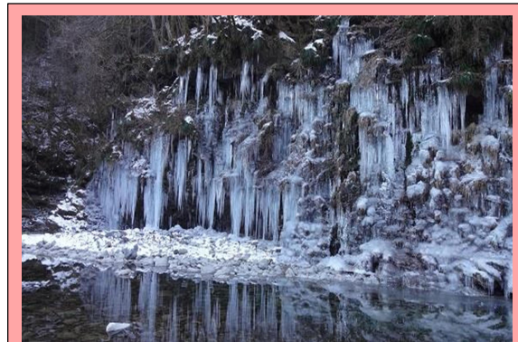
■三十槌の氷柱の様子

期間中は、1月15日(土)から2月20日(日)にかけて氷柱のライトアップを行います。