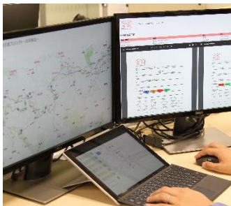
運行集中管理センター イメージ

各モビリティの位置情報を専用端末等でリアルタイムに取得。配送事業者/荷主に対して到着予定時刻や配送開始指示をセンター側から自動通知をします。